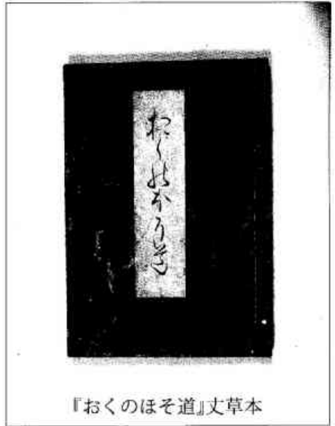
『おくのほそ道』文草本

山形領に立石寺と云山寺あり。慈覺大師の開基にして、殊静閑の地也。一見すべきよし、人々のすゝむるに依て、尾花沢よりとつて返し、其間七里ばかり也。日いまだ暮ず。麓の坊に宿かり置て、山上の堂にのぼる。岩に巖を重て山とし、松栢年旧、土石老て苔滑に、岩上の院々扉を閉て物の音きこえず。岸をめぐり、岩を這て、仏閣を拝し、佳景寂寞として心すみ行のみおぼゆ。