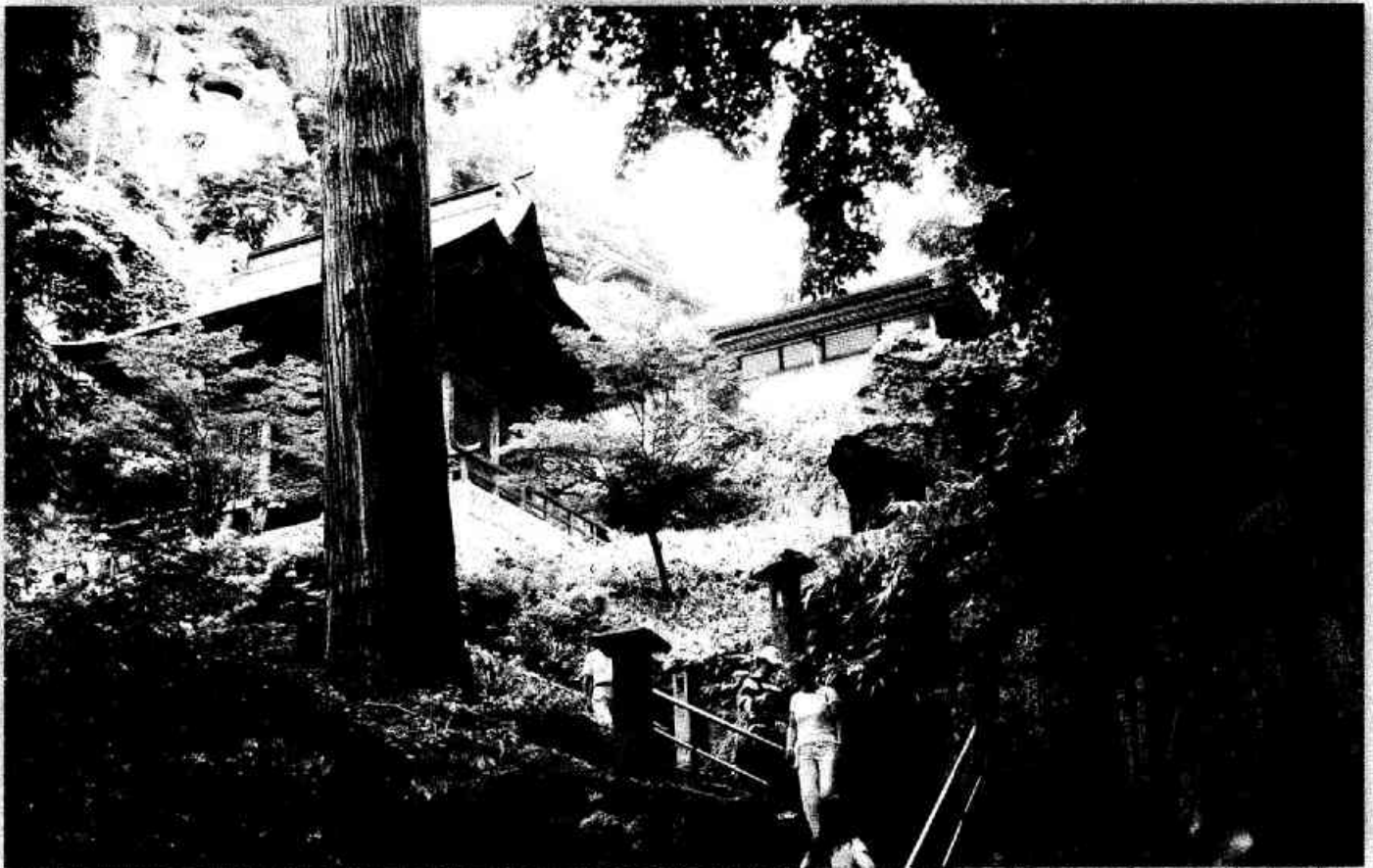
立石寺(山寺)仁王門付近